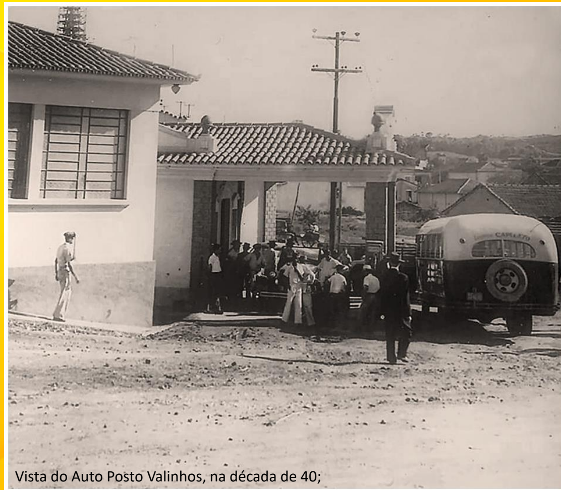
Vista do Auto Posto Valinhos, na década de 40;